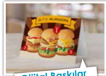
Dijital Baskılar görüldüğü gibi